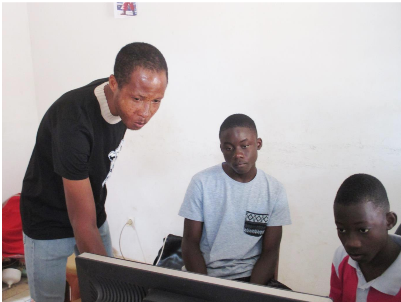
Les étudiants devant les machines