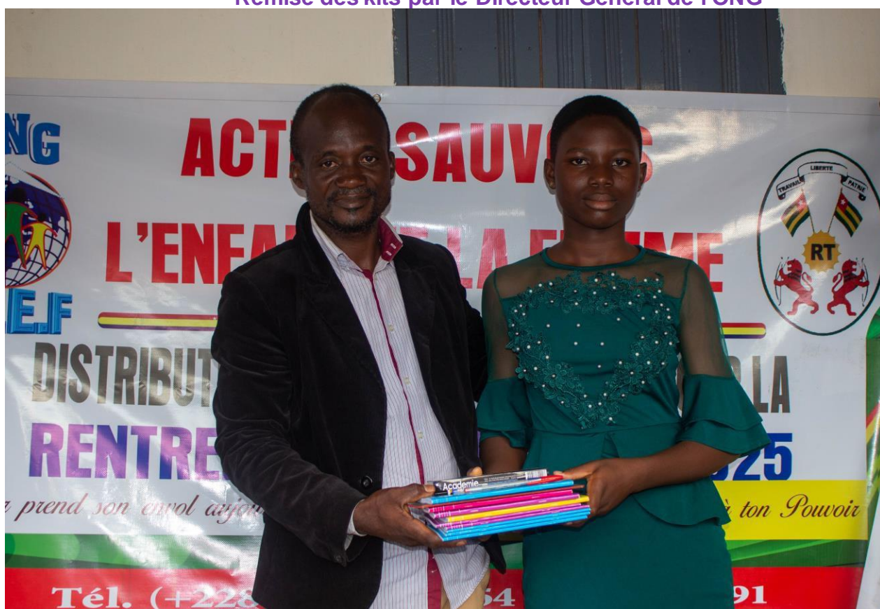
Remise des kits par le Directeur Général de l'ONG