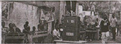
L'artiste Flash Joy en pleine démonstration d'un acte que peut poser un individu ivre.

organisé au bord de la route, à côté des revendeuses de nourritures. Les mets servis aux enfants sont accompagnés de sucreries, comme pour dire, plus jamais d'alcool dont les effets néfastes sont incalculables et indésirables. Pour bien illustrer cette situation, l'artiste pluridisciplinaire togolais, Flash Joy, invité pour la circonstance, a peint le tableau à travers un scénario. Suivant l'interprétation de la scène, apparemment noyé