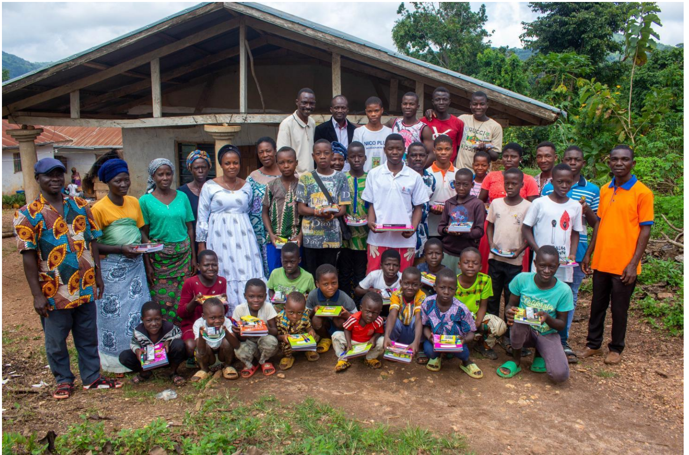
Vue partielle des récipiendaires de Zogbégan avec les parents présents ainsi que les Responsables de l'ONG ASEF