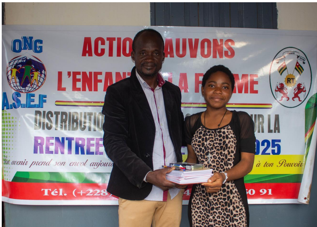
Remise des kits par le Directeur Général de l'ONG