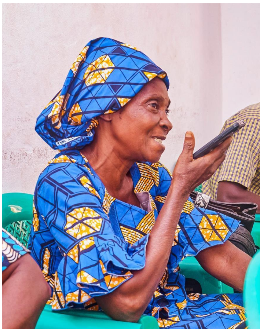
L'intervention d'une veuve participante à Lomé