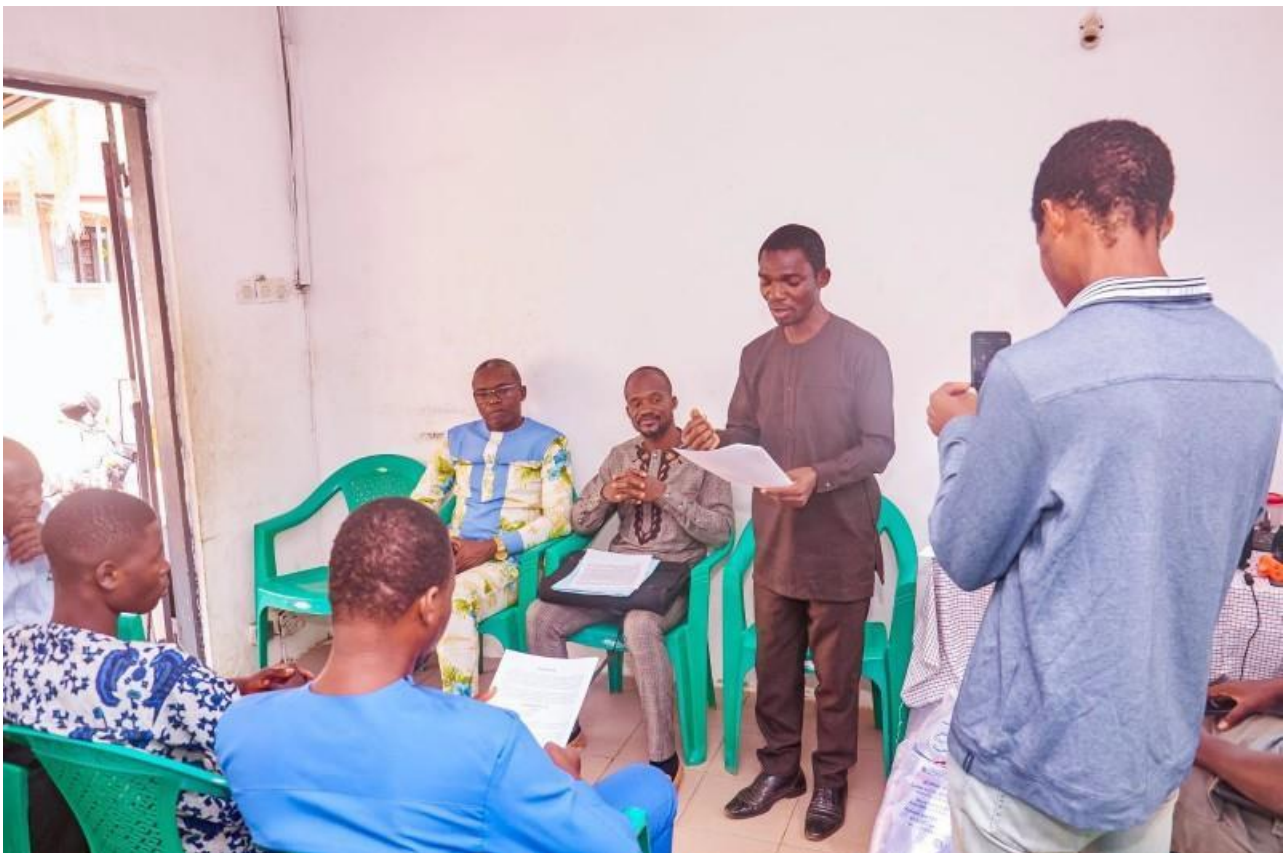
Présentation des résultats du suivi au niveau de Lomé par PARGO Paloukinam