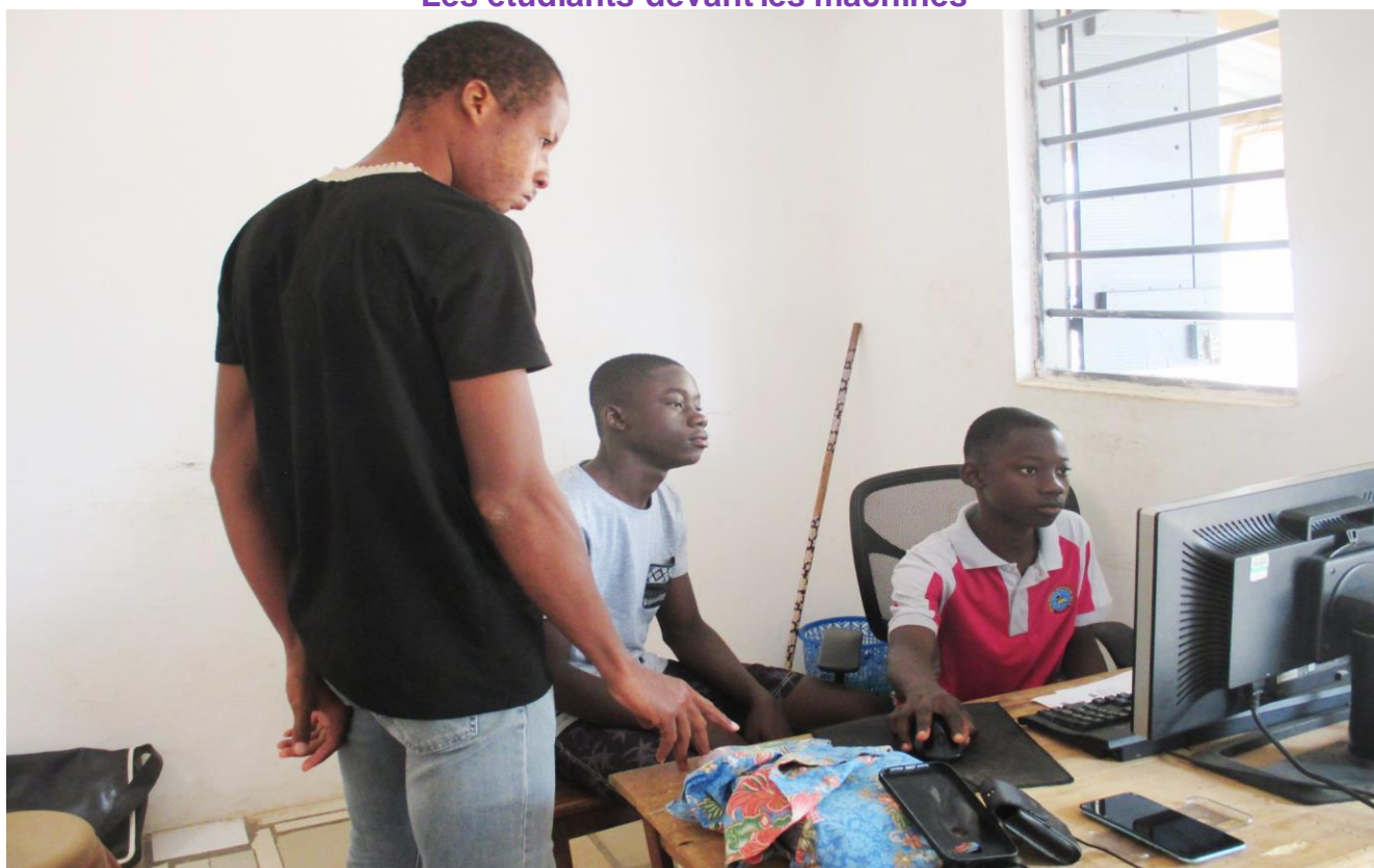
La pratique se poursuit