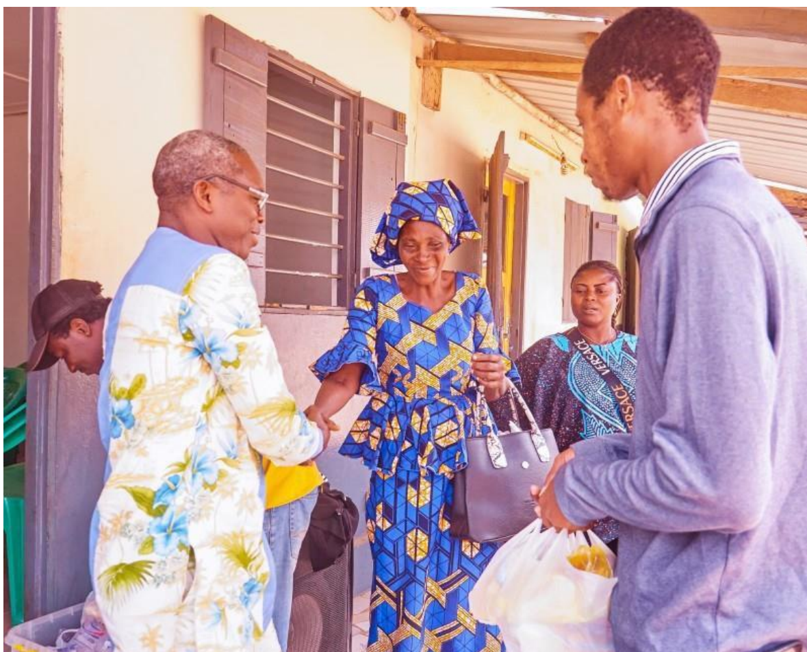
Rafraichissement à l'issue de la rencontre