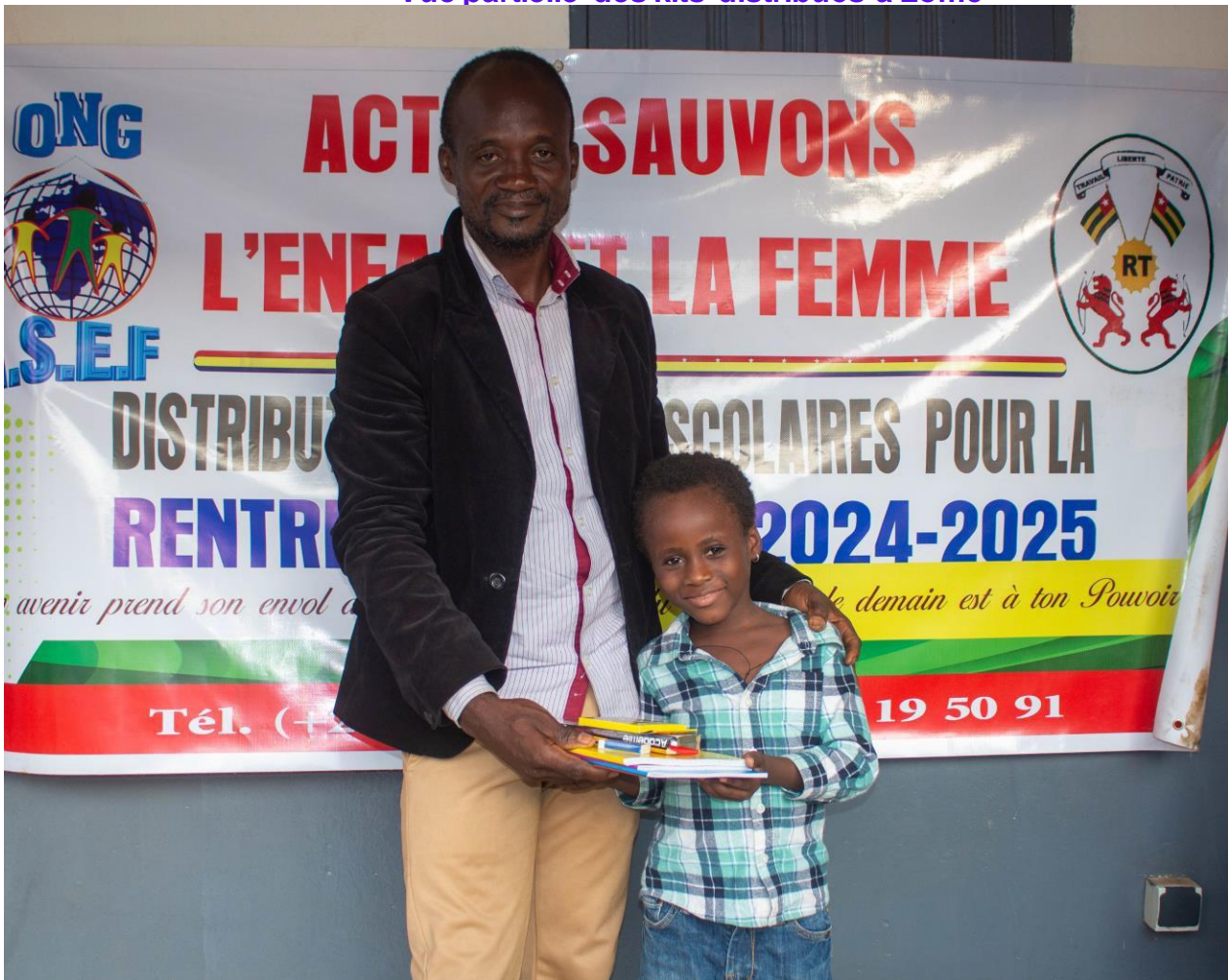
Remise des kits par le Directeur Général de l'ONG