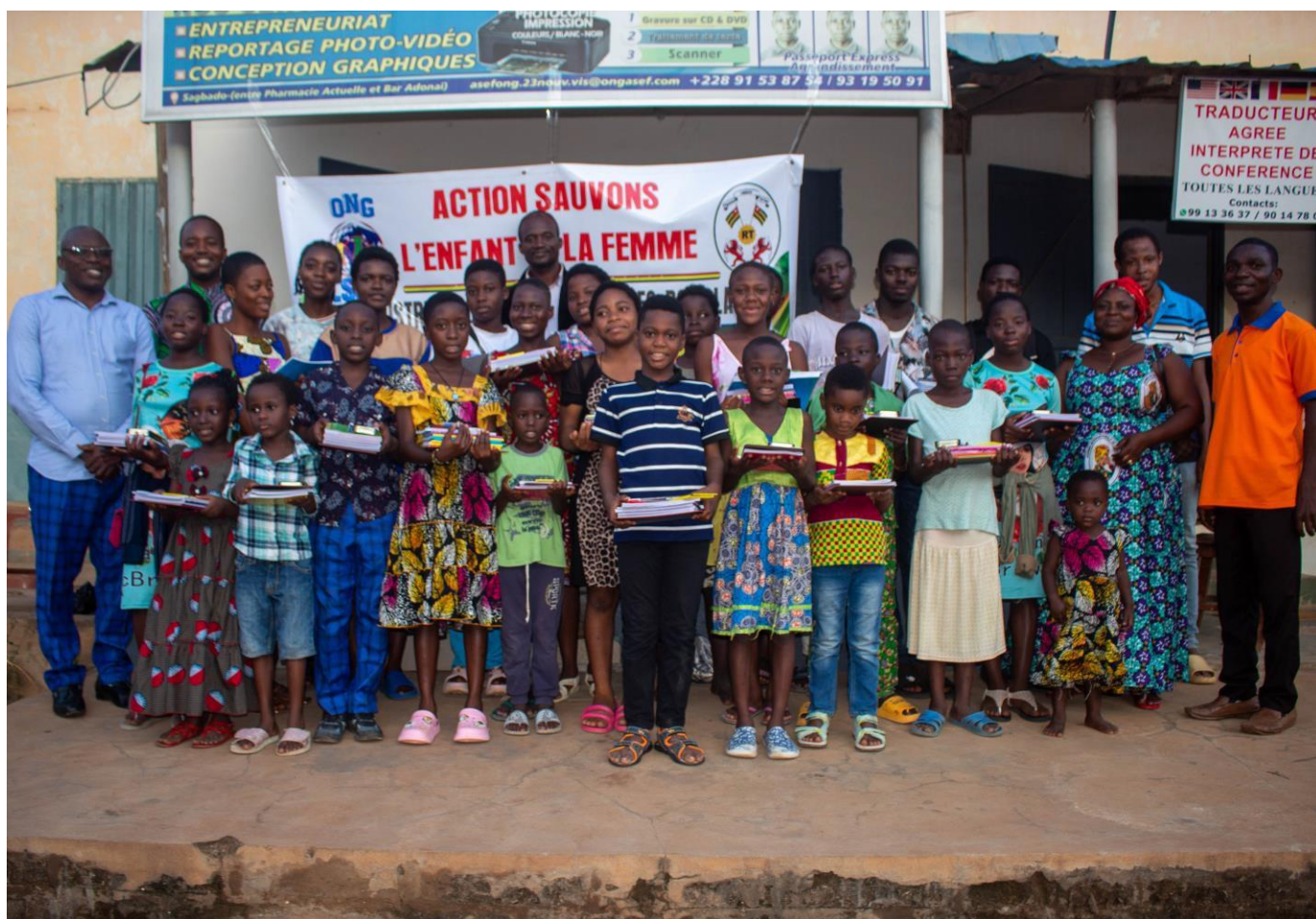
La photo de famille d'une partie des participants avec les kits en mains