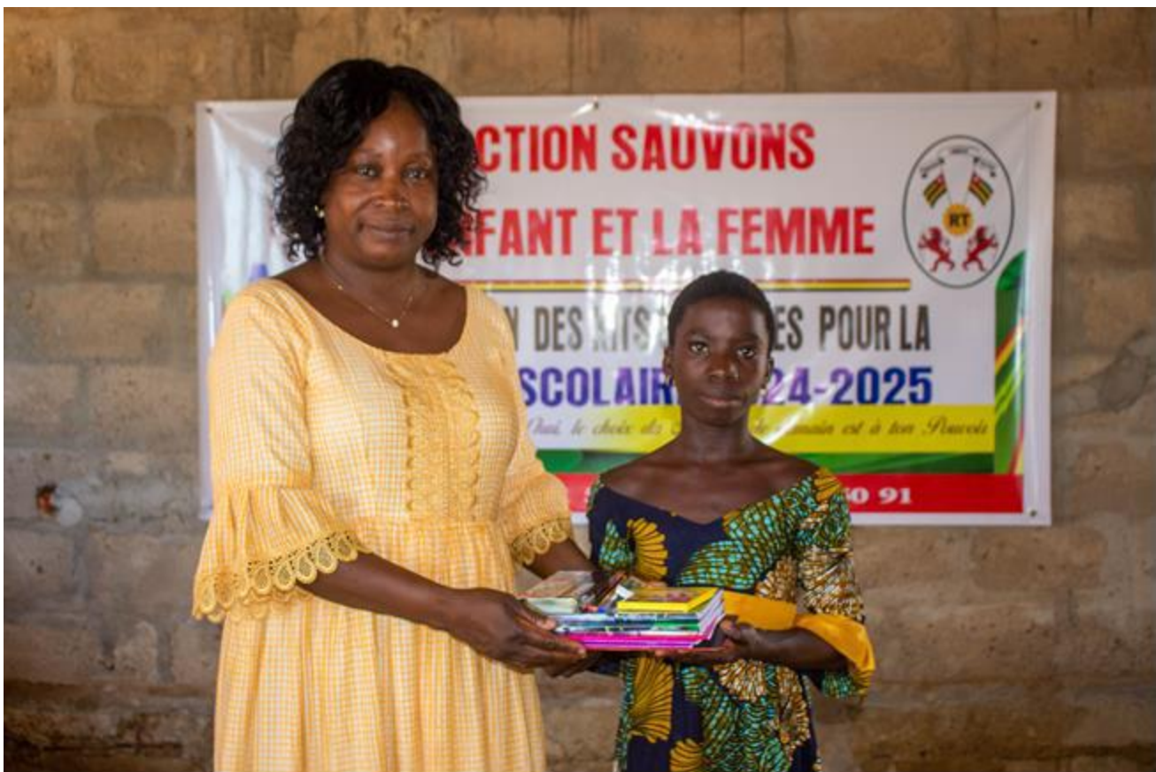
Cette élève aussi reçoit son kit des mains de la responsable locale de l'ONG