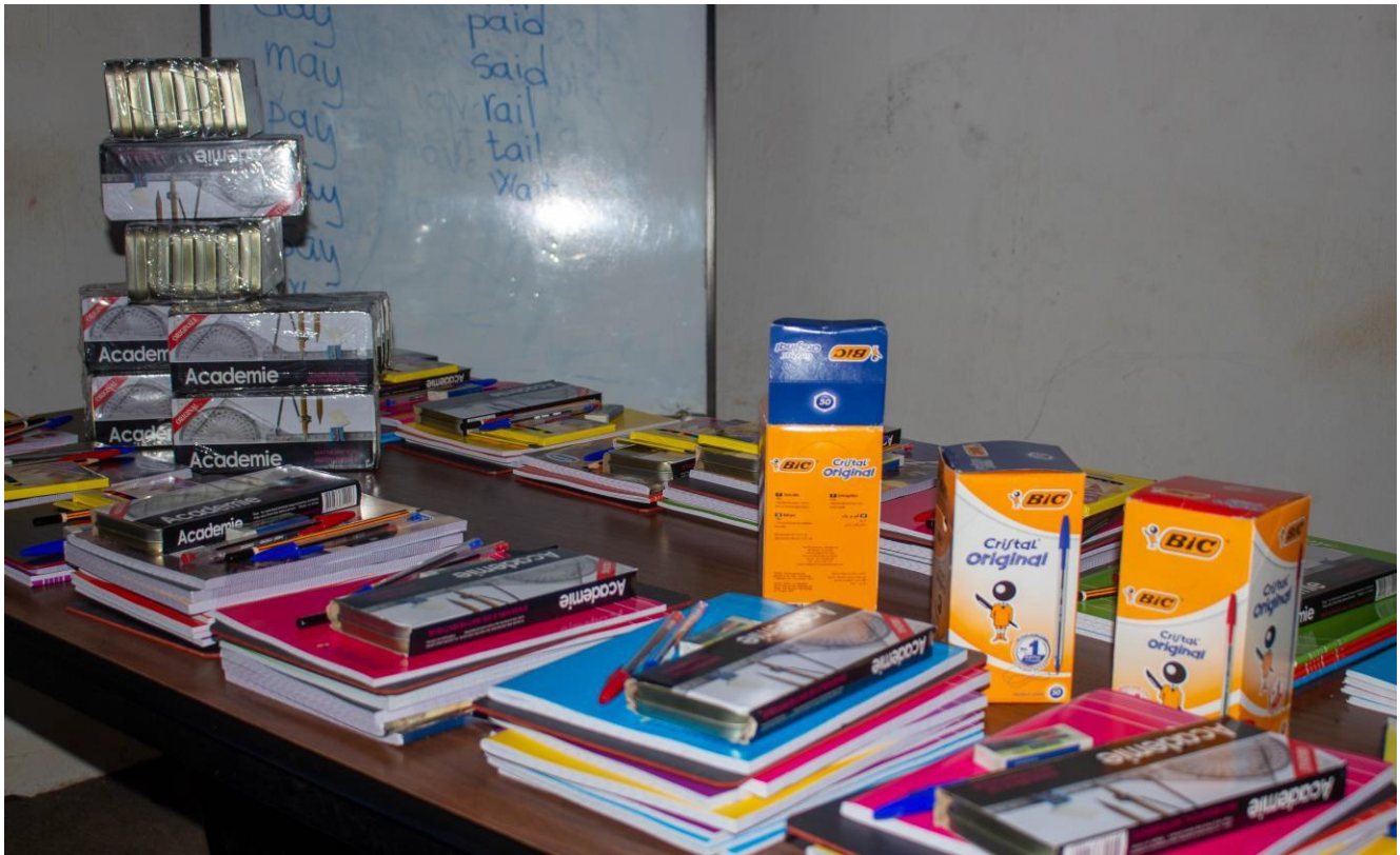
Vue partielle des kits distribués à Lomé