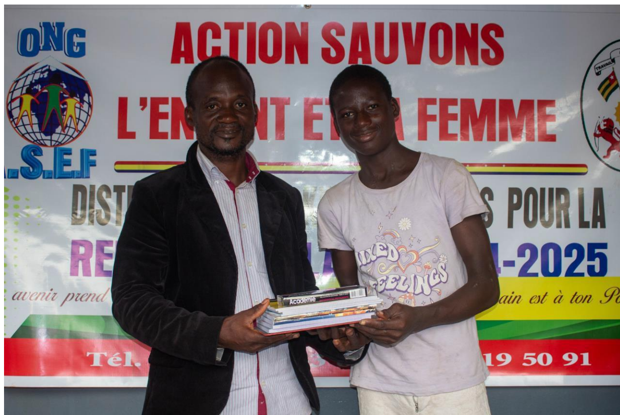
Remise des kits par le Directeur Général de l'ONG

L'apothéose de la tournée de distribution s'est déroulée à Lomé le 12 Septembre 2024 avec plus d'une centaine d'enfants ayant reçu des kits au siège de l'ONG ASEF à Sagbado. Le programme a touché plus de 57 nécessiteux qui ont, avec bonheur, reçu ces précieux kits pour leur assurer une bonne rentrée scolaire 2024-2025 avec promesse de ramener une brillante réussite à la fin de l'année.