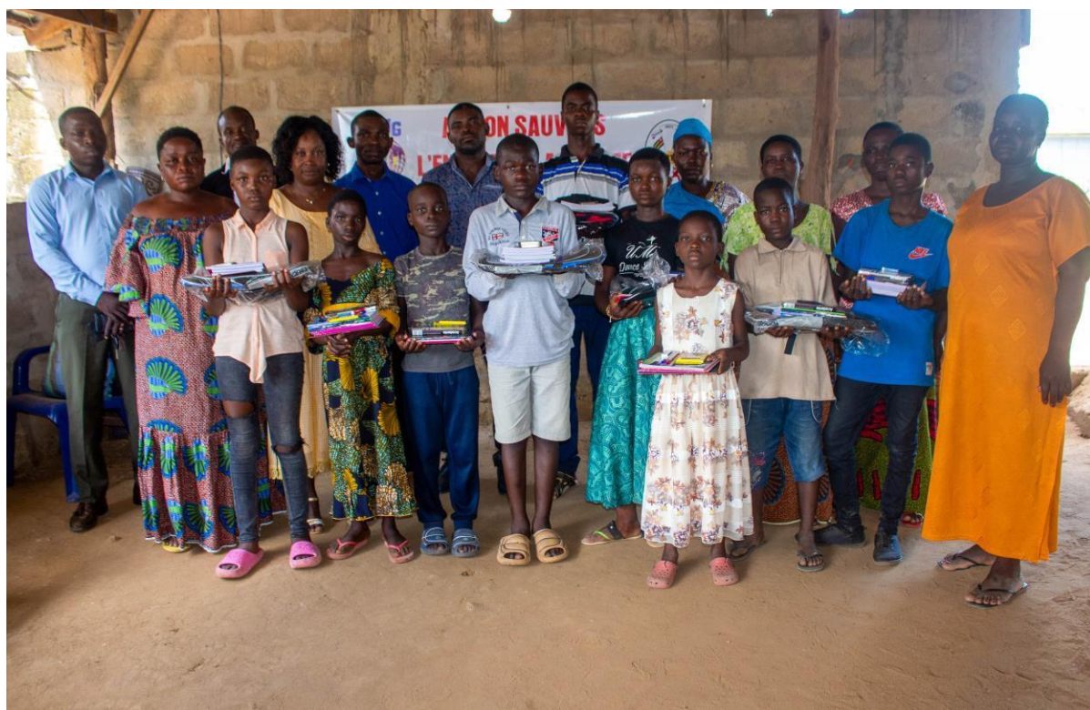
Photos des récipiendaires avec les responsables de l'ONG à Kara