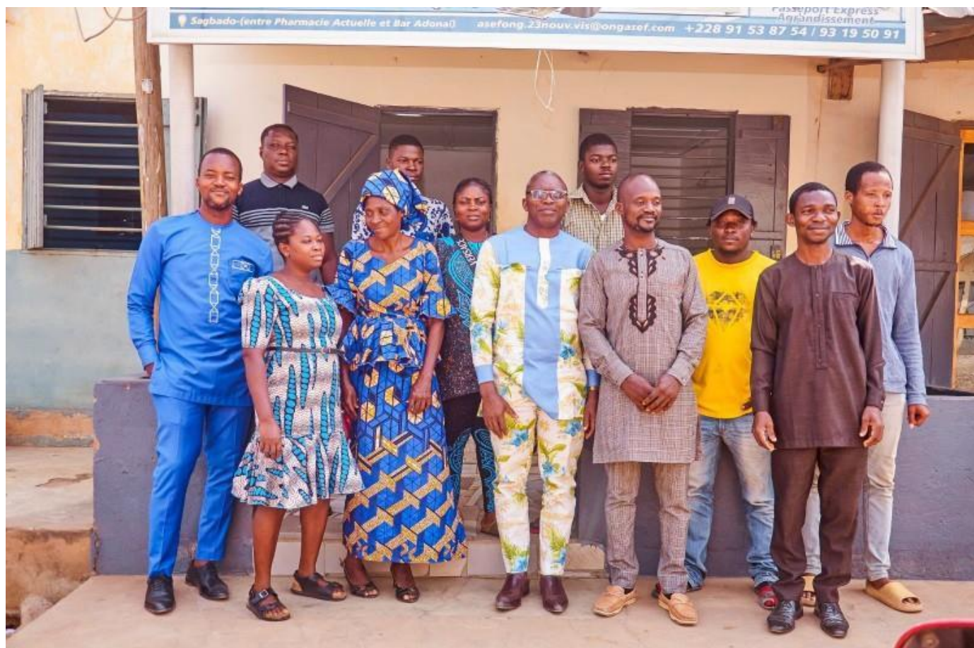
Photo de famille d'une partie des participants en présentiel de la rencontre.